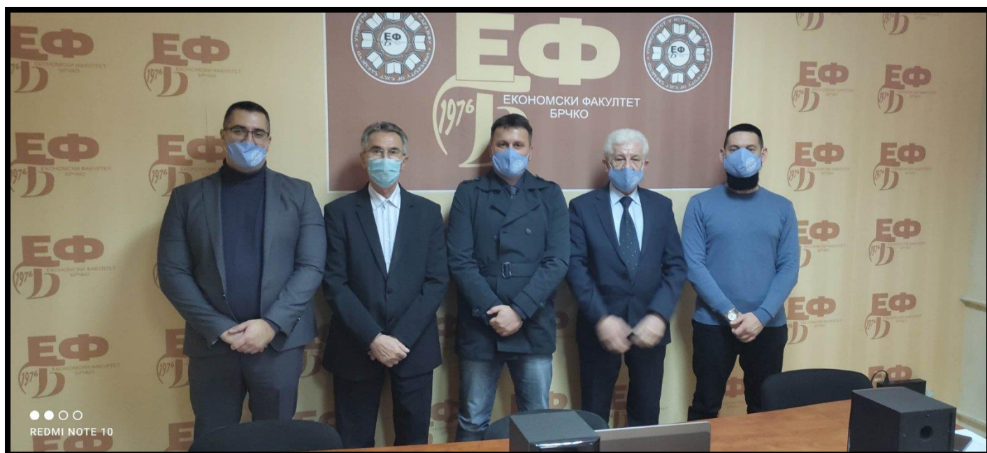
Комисија за организацију ICFE-BD 2021